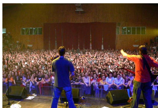
Rock in Plzeň 2006 - Divokej Bill